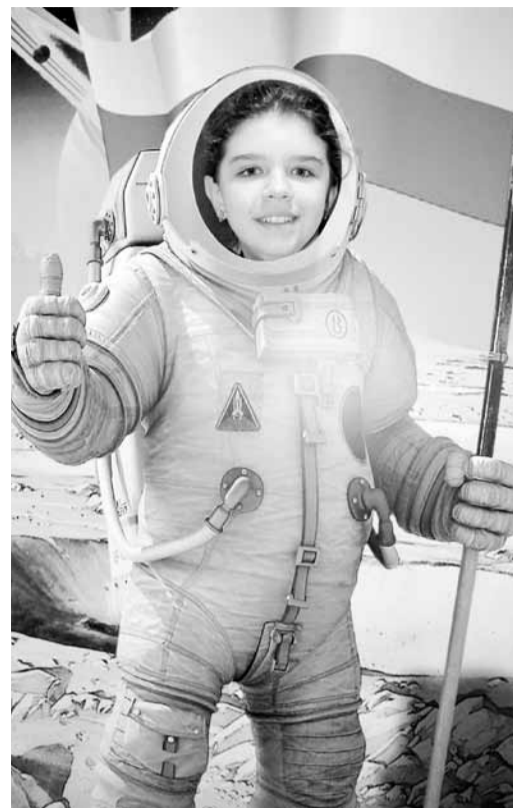
В музее «Самара космическая»

Ну а мое выступление на «Взрослом часе» было посвящено проекту «Профсоюзный эдьютон», ведь эти ролики полезны не только профсоюзным активистам и лидерам, но и всем педагогам: они рассказывают, например, как делать презентации - какие угодно, организовывать мероприятия - где угодно, фотографировать - кого угодно. Кстати, напоминаю, где можно найти все видеоролики сразу: https://www.youtube.com/playlist?list=PLvKy_jBUkGLr0_2jJC_MIDMQVHTVIWTPX .