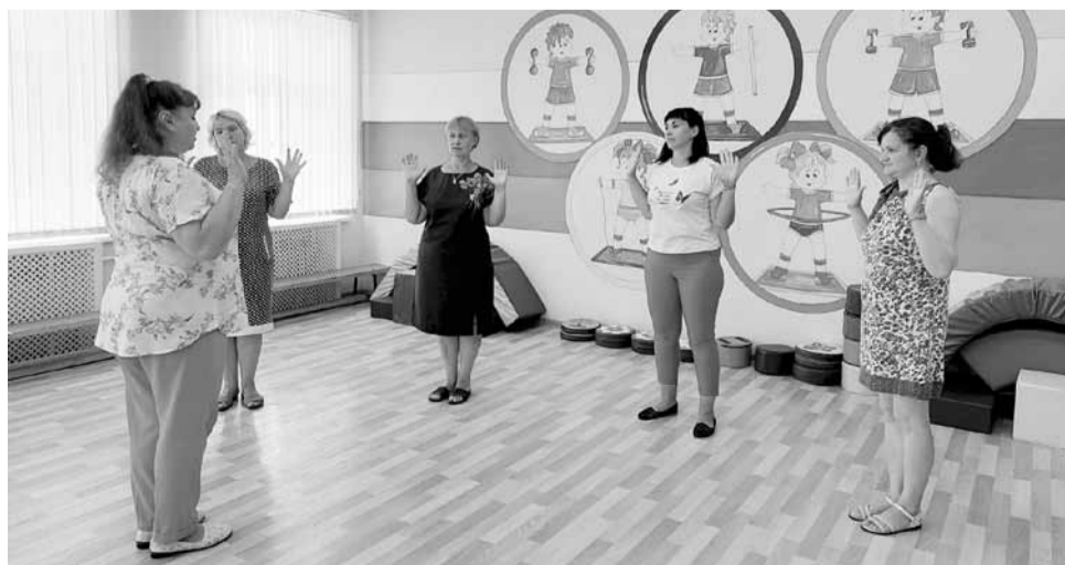
Дыхательная гимнастика по системе А.Н.Стрельниковой