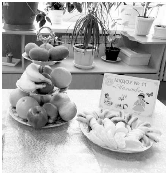
Просим к столу!

Здоровье - это бесценный дар природы, который нужно беречь, и во многом оно зависит от самого человека, от его образа жизни, условий труда, питания и привычек.