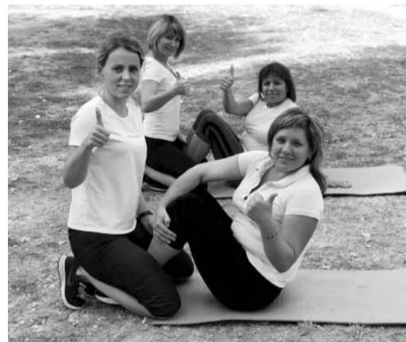
Спорт - это здоровье