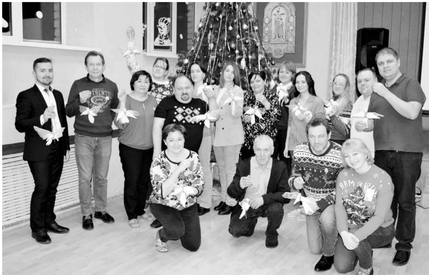
Педагоги зимней школы с рукотворными ангелами