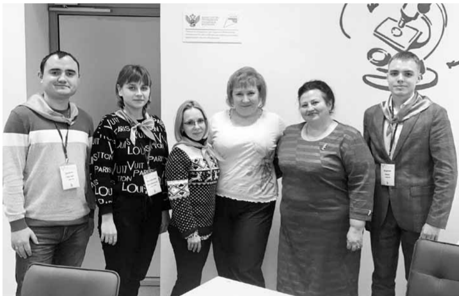
На секции форума - молодые ученые