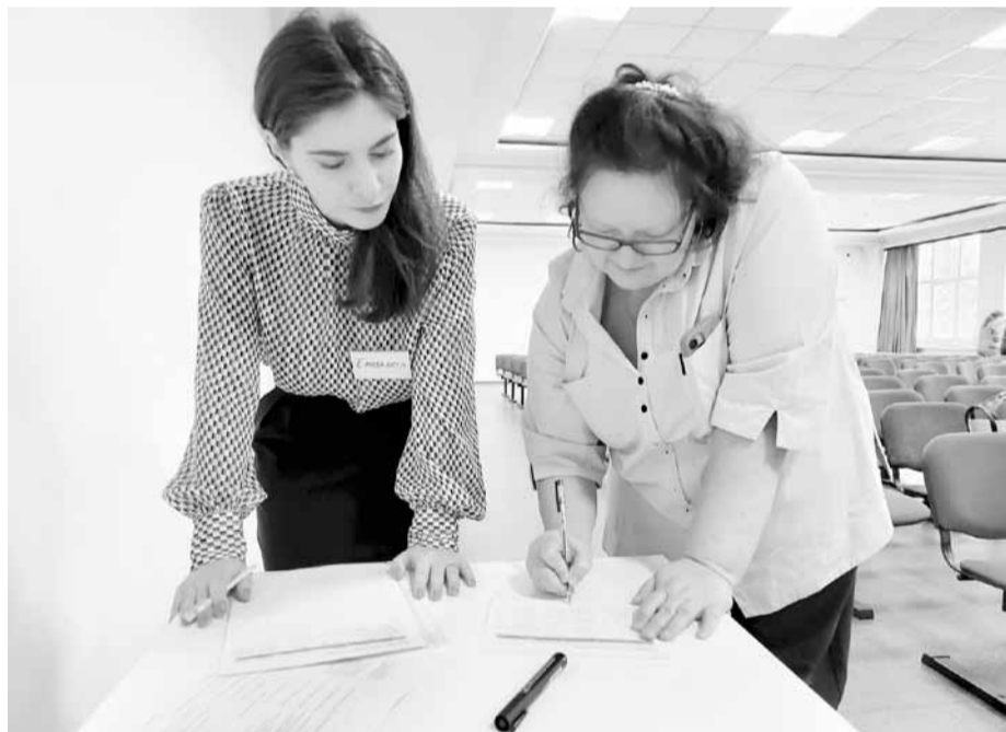
В паре молодой учитель и наставник, значит, будет успех

Следующий пункт программы - презентация социального проекта Ямалской окружной организации профсоюза и регионального Совета молодых педагогов «Учитель-волонтер Ямала». Цель проекта