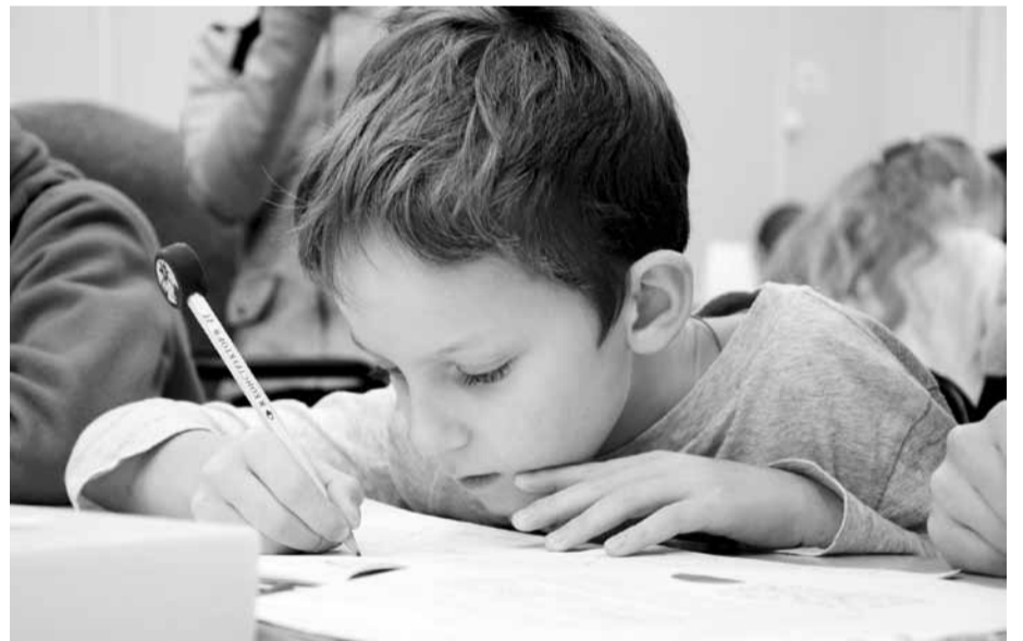
Конкурс «Чистописатель» провели накануне Дня почерка

Во второй части методического объединения опытом поделились заместитель заведующего