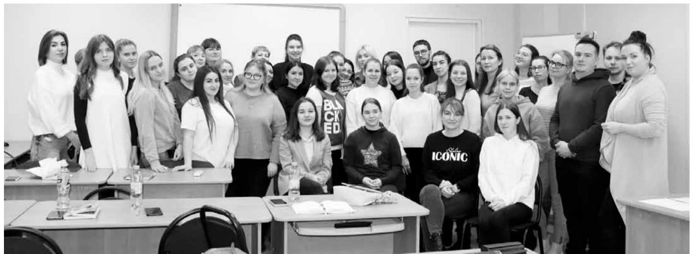
Семинар для молодых педагогов в Центре развития образования Петрозаводска

Игорь ВЕТРОВ, по материалам региональных организаций Общероссийского Профсоюза образования