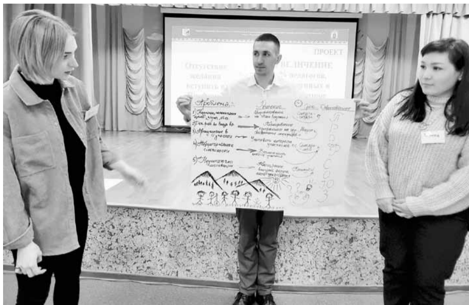
Вот так работал проектный офис

Затем начал свою деятельность проектный офис «Год педагога и наставника: смыслы, события, результаты». Участники мероприятия разделились на три команды, которые выработали ряд предложений по привлечению в профсоюзное движение новичков. Среди них - курирование молодыми педагогами - членами профсоюза педаго-