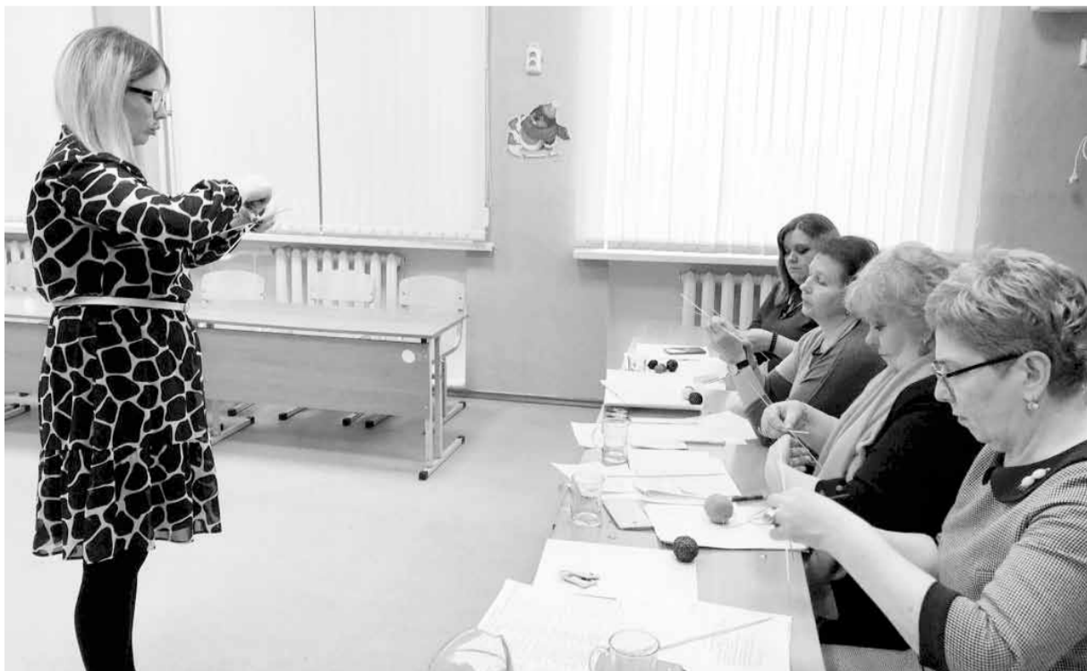
В ходе конкурсных испытаний